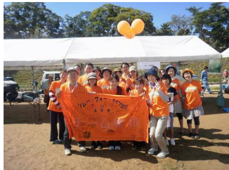
リレーフォーライフへの参加 (松山ベテル病院)