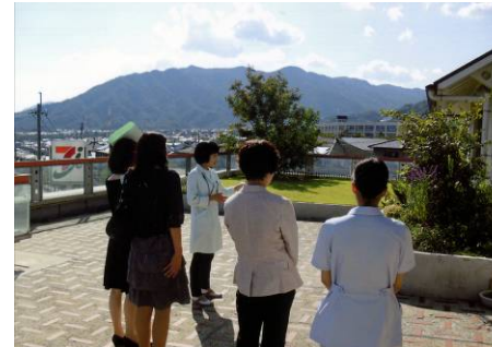
緩和ケア病棟見学会 (廿日市記念病院)