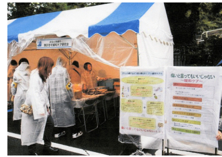
薬学生によるイベントでの啓発活動 (北里大学薬学部)