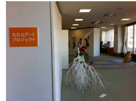
美大生による病棟での作品展示会 (たたらリハビリテーション病院)