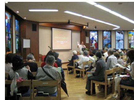
一般市民向けの公開講座 (淀川キリスト教病院)