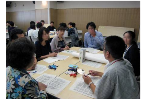
多職種による模擬カンファレンス (徳島県立中央病院)