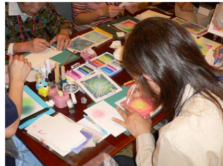
遺族サロンでのアートセラピー (石川県済生会金沢病院)