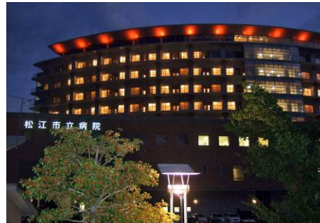
病院ライトアップ (松江市立病院)