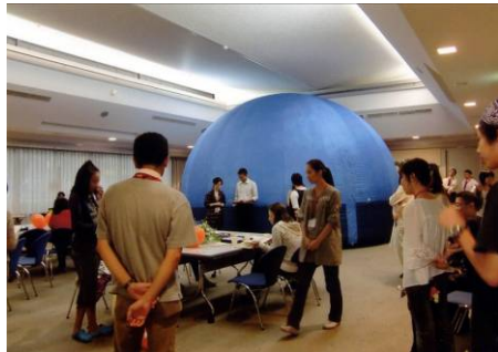
患者・家族の緩和ケアサロン(プラネタリウム上映) (神戸大学医学部附属病院)