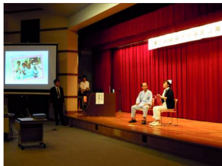
市民向け講座での医療者による寸劇 (小田原市立病院／ピースハウス病院)