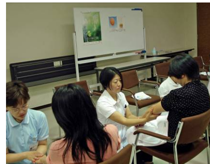
看護師によるアロママッサージ体験 (山田赤十字病院)