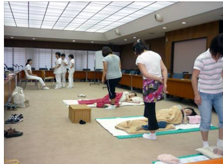
フーセラピー体験講習会 (琉球大学医学部附属病院)