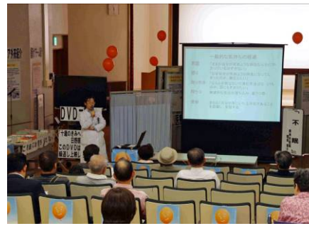
一般市民向けのミニレクチャー連日開催 (JR 東京総合病院)