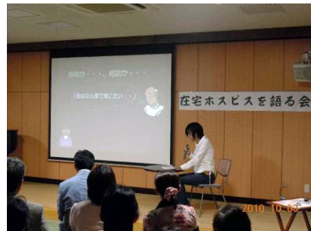
在宅ホスピスを語る会 (ふくおか在宅ホスピスをすすめる会)