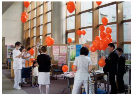
がん・緩和ケアのパネル展示 (NTT 東日本札幌病院)