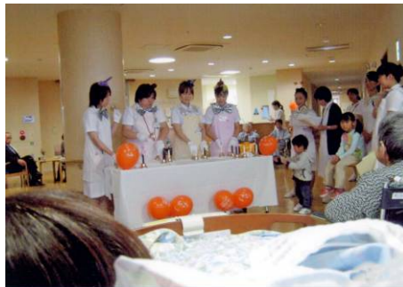
職員によるハンドベル演奏会 (社団医療法人啓愛会 孝仁病院)