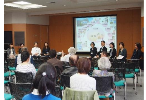
語り合おう「病院でも緩和ケア、お家でも緩和ケア」