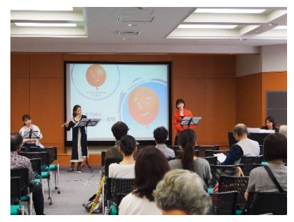
祈りのコンサート