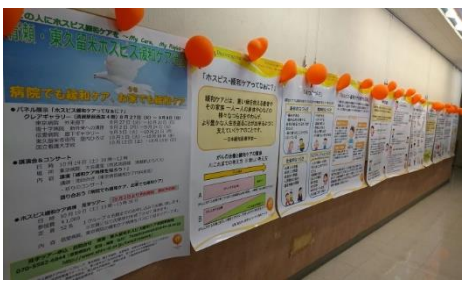
クリアギャラリー（清瀬駅前）