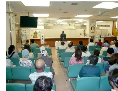
寺院住職による落語 (坪井病院・福島県)