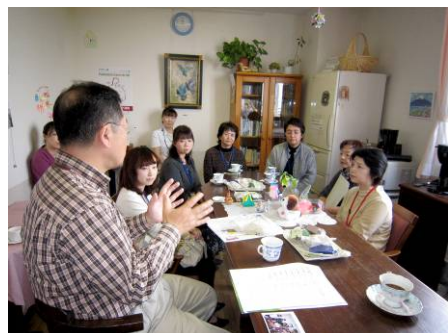
地域の訪問看護師を招いた見学会 (筑波メディカルセンター病院・茨城県)