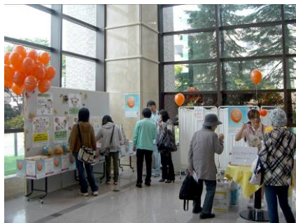
がん・緩和ケアのパネル展示 (王子総合病院・北海道)