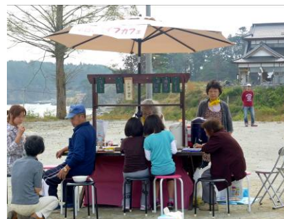
復興ライフカフェ (穂波の郷クリニック・宮城県)