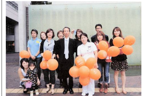
街頭での啓発活動 (県北ブロック緩和ケア認定看護師会・長崎県)