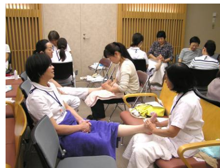
医療者対象のリフレクソロジーセミナー (日本リフレクソロジスト養成学院・東京都)