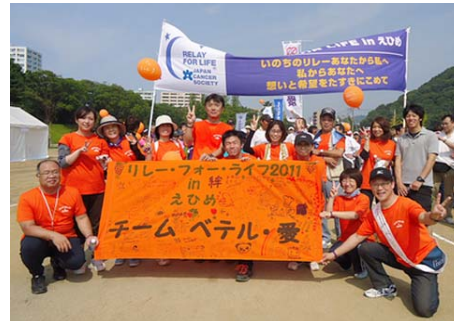
リレーフォーライフへの参加 (松山ベテル病院・愛媛県)