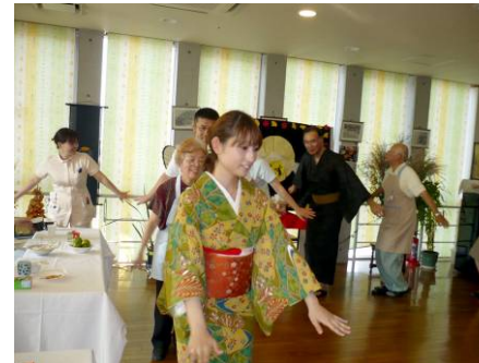
お月見会 (那珂川病院・福岡県)