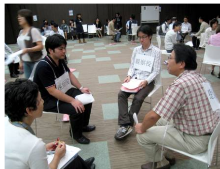
医師を対象とした緩和ケア研修会 (多摩総合医療センター・東京都)