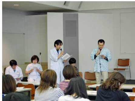
市民公開講座での朗読劇 (高山赤十字病院・岐阜県)