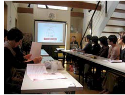
地域カフェでの緩和ケアサロン (音羽記念病院／大山病院・京都府)