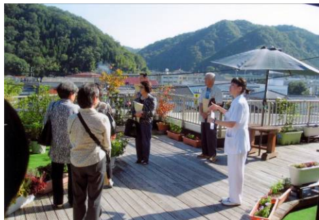
緩和ケア病棟見学会 (公立みつぎ総合病院・広島県)