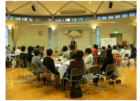
遺族会 (岡山済生会総合病院・岡山県)