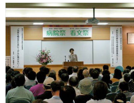
がん体験者による講演会 (長野赤十字病院・長野県)