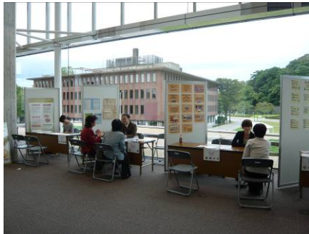
相談コーナーの設置 (石川県在宅緩和ケア支援センター・石川県)