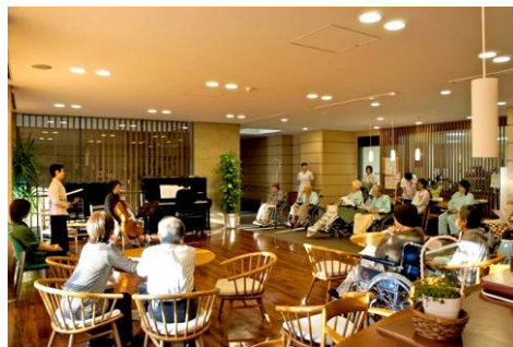
コンサート (盛岡赤十字病院・岩手県)